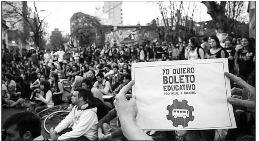
Marcha estudiantil en La Plata

Tras la votación en la Legislatura bonaerense, Scioli deberá promulgar y reglamentar la ley. Pero ya adelantó que intentará limitar la cantidad de viajes mensuales y reducir al mínimo los viajes de larga distancia para los universitarios. Una vez más, el gobierno actúa en representación de las empresas del transporte. Por eso hay que seguir movilizadas y luchar por la aplicación inmediata y sin limitaciones del boleto gratuito. Con el enorme ejemplo del movimiento estudiantil bonaerense, ahora tenemos que ir por el boleto estudiantil nacional.