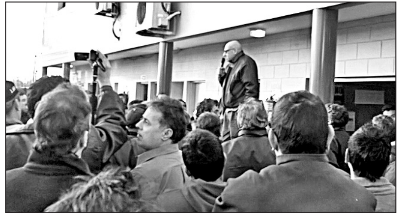
Asamblea de los choferes de la 60