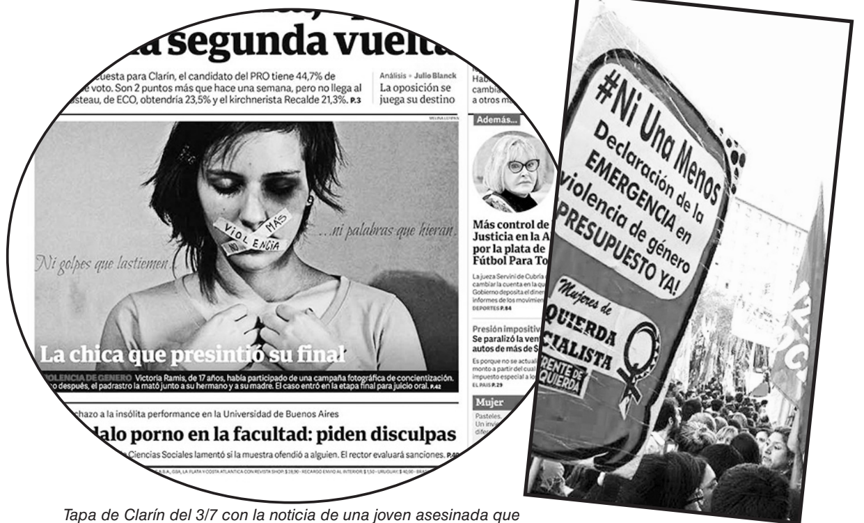
Tapa de Clarín del 3/7 con la noticia de una joven asesinada que había hecho una campaña de fotos denunciando amenazas

Pero desde el día siguiente, poco y nada hicieron para responder a los principales reclamos que se exigieron en las calles. A un mes, el gobierno nacional solo anunció la contratación de 50 operadores telefónicos para la línea 144 que atiende consultas de las víctimas de violencia y señaló que finalmente pondrá en marcha el Registro Único de Femicidios que lleva 7 años de retraso. Algunas provincias también realizaron medidas igualmente insuficientes: Chaco creará