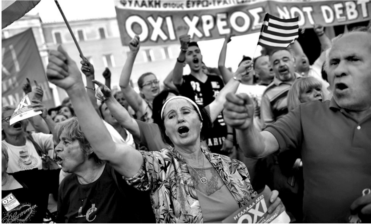
El pueblo griego votó por el NO y salió a la calle a repudiar a la Troika. La movilización debe continuar

La Troika ha sido nuevamente derrotada. Pero existe el peligro que los dirigentes de Syriza y su gobierno de centroizquierda, encabezado por Alexis Tsipras, vuelvan a ceder a las presiones y pacten un nuevo acuerdo que no le sirva al pueblo griego y su juventud. La otra variante es que obligados por las presiones del triunfo popular del NO y las duras pretensiones de la Troika, no puedan cerrar un acuerdo, la crisis siga y se mantenga un no pago (default) de la deuda griega. Desde ya la crisis es muy aguda.