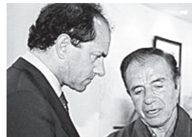
Ayer: Scioli y Menem

"Jamás dejé de respetar y tener un cariño por el Dr. Carlos Menem que me pidió especialmente que saludé al pueblo riojano", dijo Scioli al concurrir a La Rioja el pasado domingo a festejar el fraude que consagró al candidato del PJ de Beder Herrera. Y agregó: "En la vida hay que ser agradecido. Ayer llamé para saludarlo (a Menem) y contarle que veníamos para acá al hombre que me dio la oportunidad y creyó en mí para ingresar a la política" ( Clarín , 2/7). Ese es el candidato con el que el gobierno "nacional y popular" y que se dice "progresista" llama a enfrentar el ajuste de los 90. Para ello hay que votar al FIT, no a Scioli.